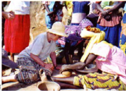
Tourisme et développement solidaire propose de partager la vie d'un village burkinabé.

Les adolescents, eux, feront leur apprentissage de citoyens européens. Pour les sensibiliser à la question de l'unification européenne, Loisirs